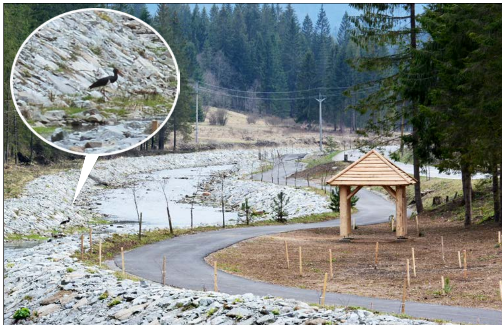
Na snímke časť upravenej plochy okolo chodníka s vysadenými drevinami, jedným z viacerých doplnkov - altánkov, ktoré budú dotvárať túto časť Oravíc a v detaile chránený bocian čierny.