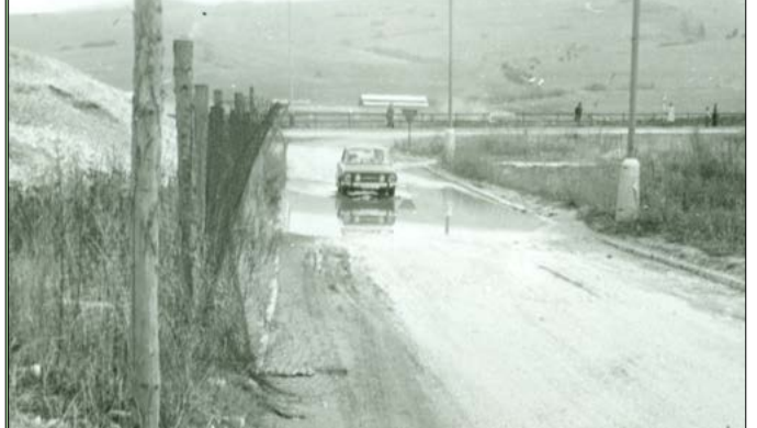
Prijazdová cesta na sídlisko Medvedzie z roku 1978. Dnes je tu už vybudovaný kruhový objazd, nákupné centrum Tesco a miesto neupraveného terénu sú tu vybudované pekne chodníky.