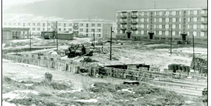
Výstavba materských škôlok v roku 1979. V súčasnosti je okolie pekne dotvorené chodníkmi a multifunkčným detským ihriskom a loďou Alica.