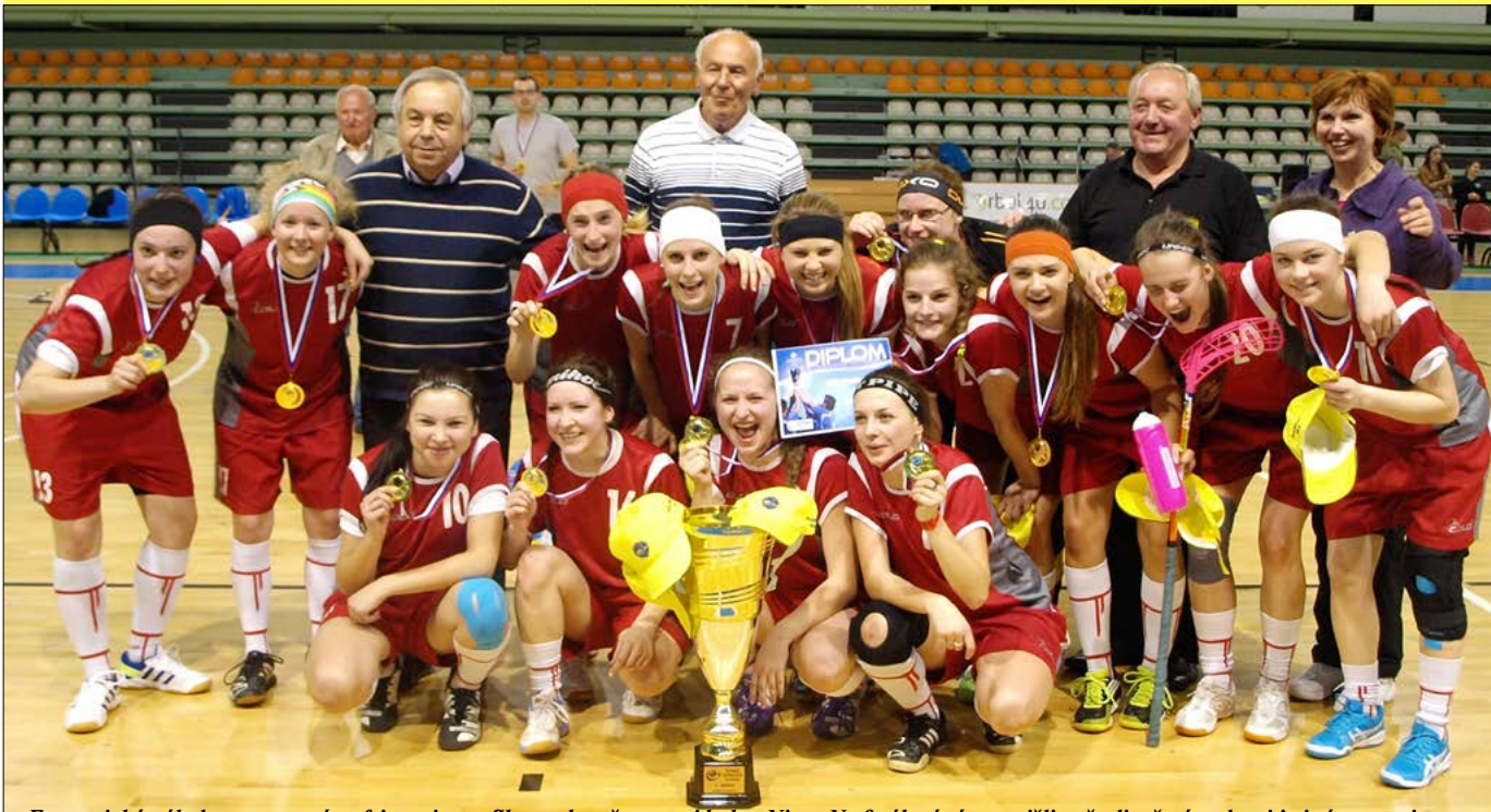
Fantastická nálada po prevzatí trofeje majstrov Slovenska v športovej hale v Nitre. Na finálový zápas prišli naše dievčatá podporiť aj zástupcovia mesta, poslanci, rodičia a fanklub, ktorý ich sprevádzal na všetkých zápasoch. Ďakujeme všetkým, ktorí sa o tento úspech tvrdošinského športu zaslúžili.

Šesť rokov naše florbalistky bojovali o popredné priečky v extralige. Tento rok získali vytúžený titul.