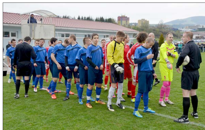
Nastúpení hráči Tvrdošína a Trstenej pred zápasom kola 4. ligy skupiny Sever.

Jar sa nám opäť prihlásila a s ňou aj futbalové súťaže. Po tvrdej zimnej príprave vybehlo na svoj prvý jarný duel naše A družstvo v Rosine, kde odohrali náročný duel, v ktorom vynikali najmä brankári.