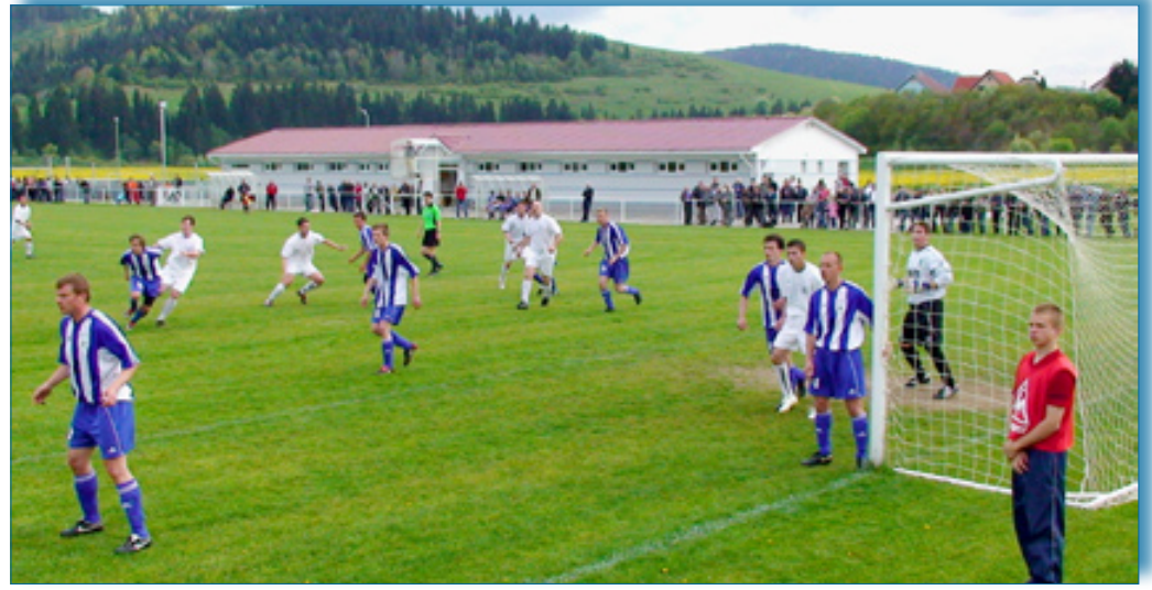
V derby s Oravskou Jasenicou sme vyhrali.