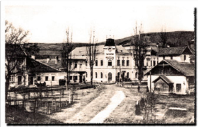
Na fotografii z roku 1910 pred radnicou, postavenou v rokoch 1872 – 1875, stojí nenápadná, no pre históriu mesta významná budova – mestský dom, ktorý bol zbúraný v roku 1910.

Stopa po Jozefovi Miloslavovi Hurbanovi, jednom z veľikánov nášho národa, zostala aj v našom meste.