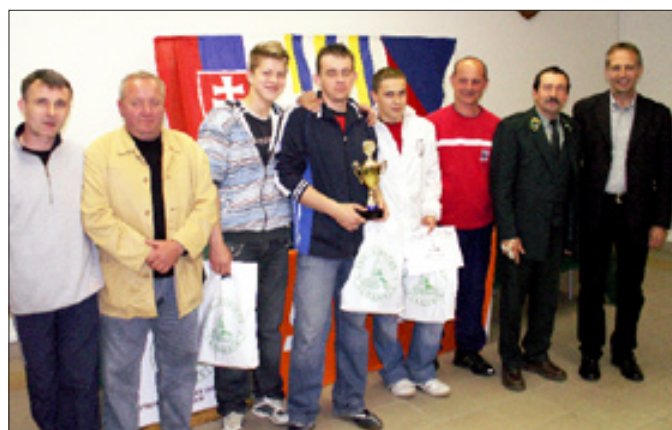
Vít'azné družstvo juniorov z SOUL Tvrdošín.

V závere J. Vorčák poďakoval všetkým zúčastneným hráčom za aktívnu účasť a korektné duely, ale aj všetkým sponzorom, hlavne však MsÚ Tvrdošín, ktorí prispeli na toto podujatie. (jh)