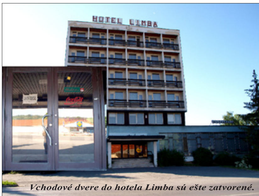
Vchodové dvere do hotela Limba sú ešte zatvorené.

Myslíme si, že aj v tejto kauze nám bol nápomocný sv. Michal, ktorý chráni naše mesto modlitbou uverejnenou v záhlaví našich novín. Veríme, že nám pomohol nielen k spravodlivému vyriešeniu kauzy Oravíc, ale aj k spravodlivému doriešeniu tohto 17-ročného neuveriteľného príbehu. Sme presvedčení, že pod jeho ochranou budú doriešené aj ďalšie nepravosti, ktoré boli nášmu mestu a našim ľuďom spôsobené.