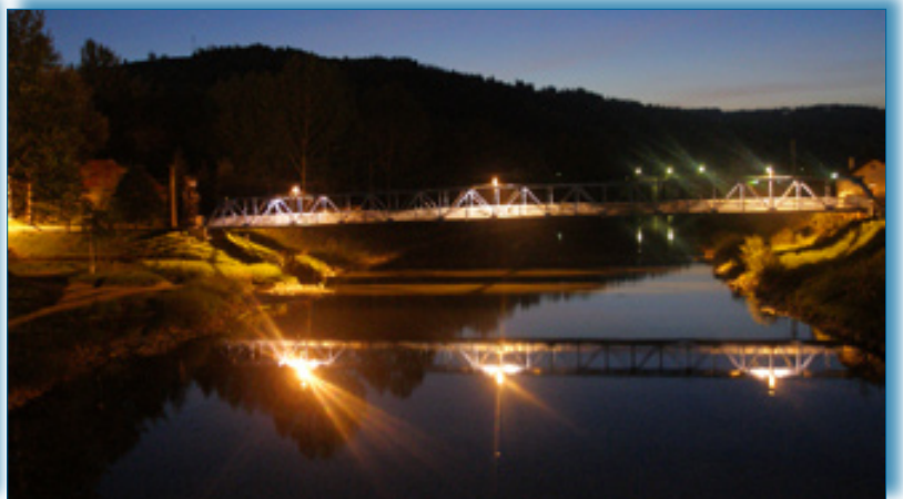
Rozžiarená podvečerná lavica.