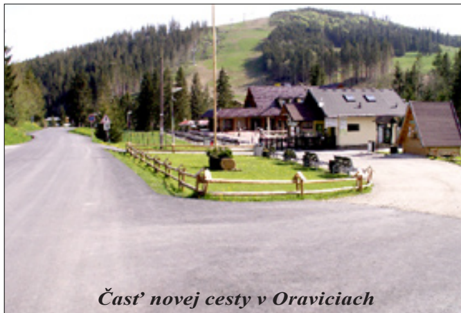
Časť novej cesty v Oraviciach

Jednou z hlavných úloh mesta je starostlivosť o svojich obyvateľov po všetkých stránkach, jednou z nich je otázka bytovej politiky. A v tomto sa nášmu mestu darí, veď za posledné roky sme už do užívania odovzdali tretiu bytovku. Záujem o byty v našom meste neutícha, je veľký a tak aj táto bytovka už má svojich obyvateľov, ktorí si kľúče od nových bytov už prevzali.