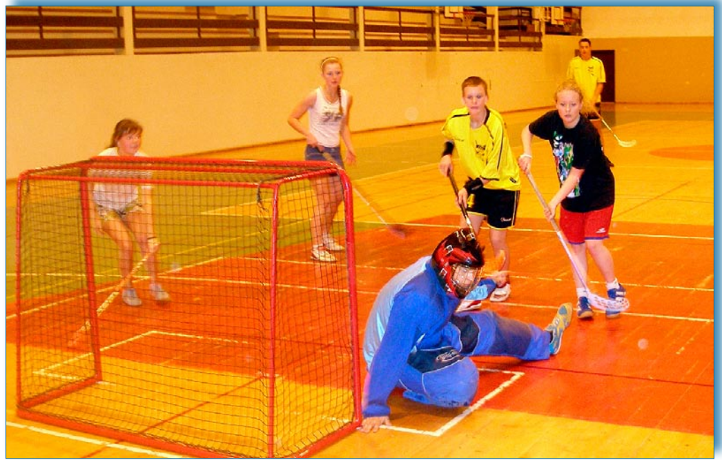
Florbalistky v rámci tréningu často popreháňajú aj chlapcov.