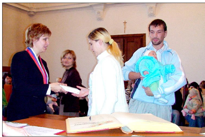
Uvítanie nových občanov na radnici.

veka vysokých hodnôt, z ktorého chcuť mať radosť obidvaja rodičia. jeme, aby ich ďalší život sprevádzali len šťastné kroky. (jh)