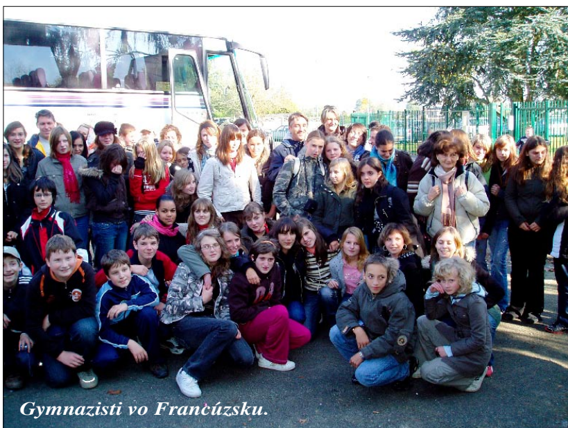
Gymnazisti vo Francúzsku.

realizácii projektu Deti zeme - rodičia Európy. Ocenenie v sídle Európskej únie prevzala naša delegácia z rúk európskeho komisára pre výchovu a vzdelávanie Jána Figela.