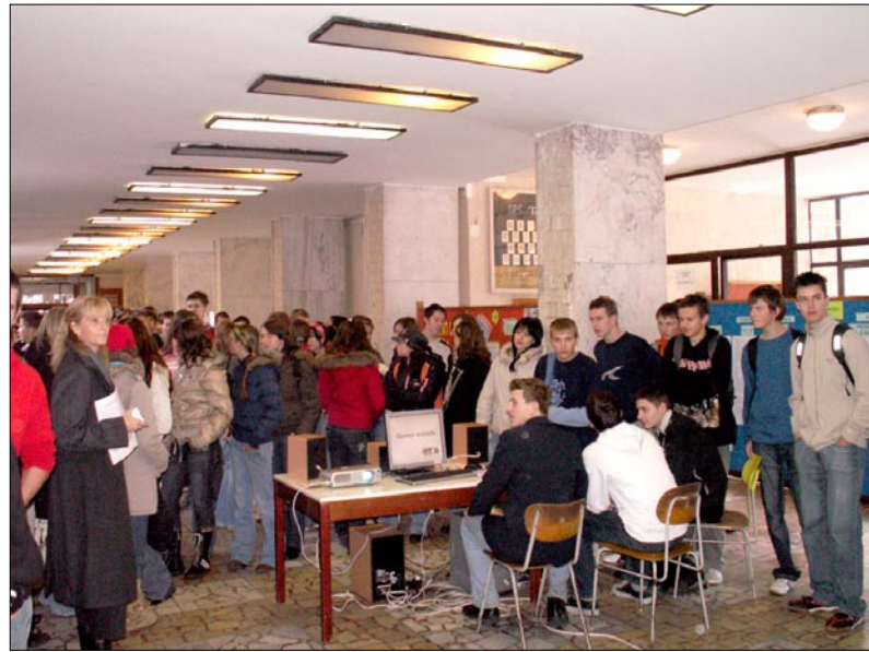
Deň otvorených dverí v Spojenej škole

Podporu máme na ministerstve, vo vedení Žilinského samosprávneho kraja, aj vo