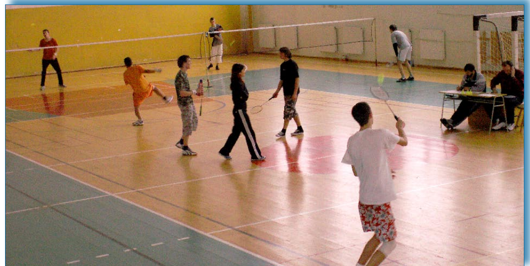
Športová hala v Tvrdošine dýchala bedmintonom.