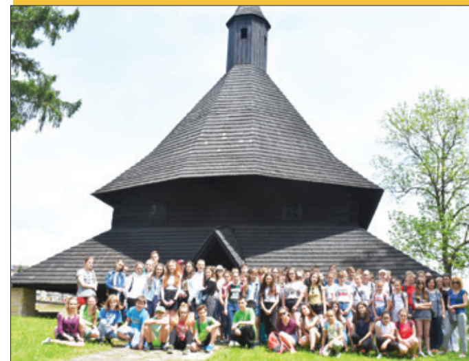
Žiaci z partnerskej poľskej gminy Laskowa pri družobnej návšteve ZŠ M. Medveckej.