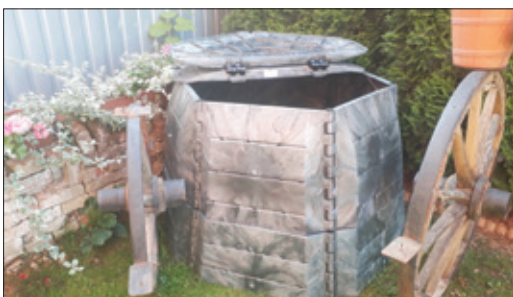
Podľa technickej správy má kompostér KOMP 750 minimálnu životnosť 15 rokov.

Centrálné umiestnené kompostéry môžu využívať ľudia alebo domácnosti s cieľom spoločne kompostovať svoje vlastné biologické odpady.