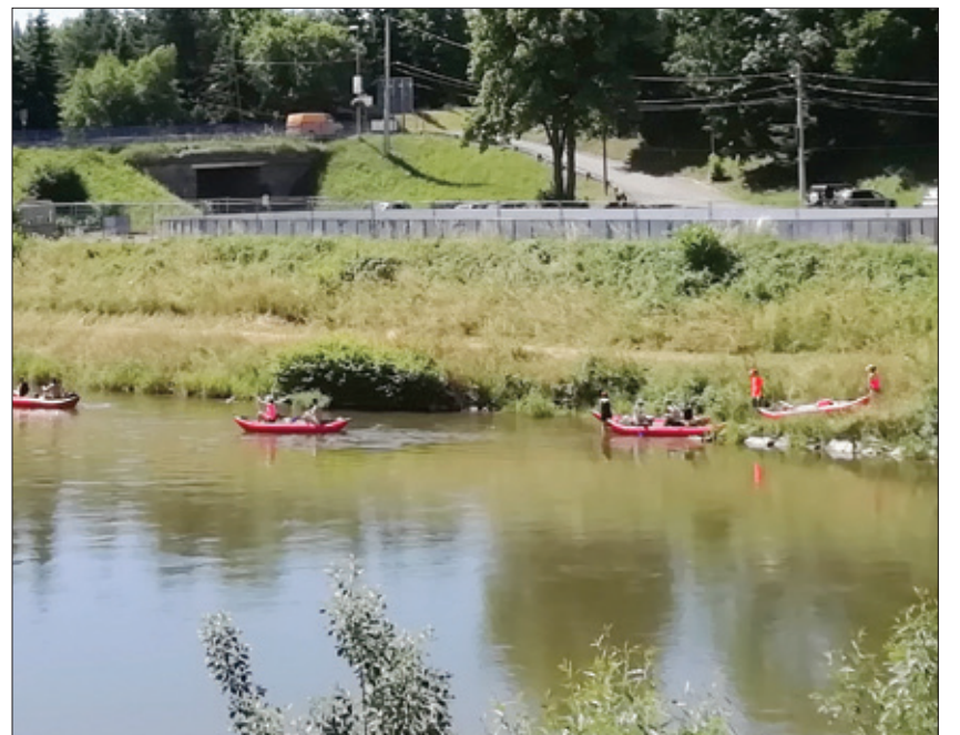
Plavba dolu Oravou patrí k jedinečným zážitkom.

nu predstavu o dovoze poľskej soli dávajú údaje z obdobia