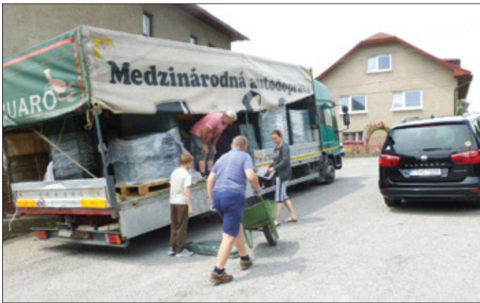
Mesto ulahčilo občanom prebratie kompostérov. Zabezpečilo dovoz do každej mestskej časti.

rozložiteľný odpad zo záhrad, parkov vrátane cintorínov a ďalšej zelene na pozemkoch