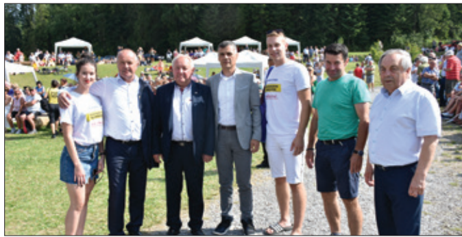
Minister obrany Peter Gajdoš (druhý zľava) s návštevníkmi Folklórnych Oravíc.

tára. Súbor zaujal programovou skladbou a tanečníci svojim temperamentom rozprúdili krv