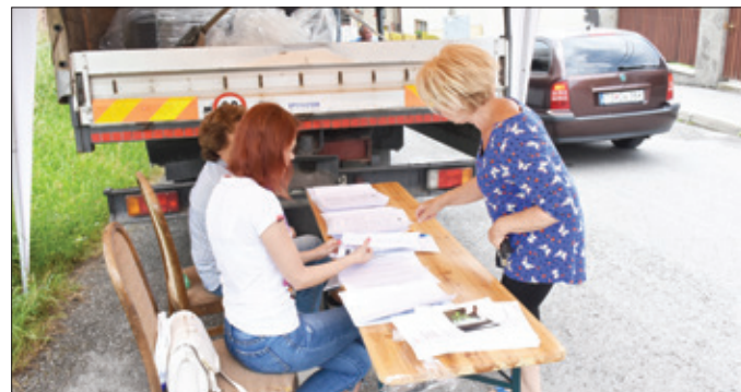
Podpísaním zmluvy a protokolu sa občania zaviazali kompostovať biologický odpad. Kompostér prejde po 5 rokoch používania do vlastníctva občanov.

Je to výborný a jednoduchý spôsob, ako môžu aj obyvatelia, ktorí majú záhrady alebo žijú v bytových domoch kompostovať svoje biologické odpady a znížiť tak hmotnosť svojich odpadov na minimum. Kompostéry budú mať svojho správcu, ktorý bude na jeho správny chod dohliadať. Aj bytové domy môžu po-