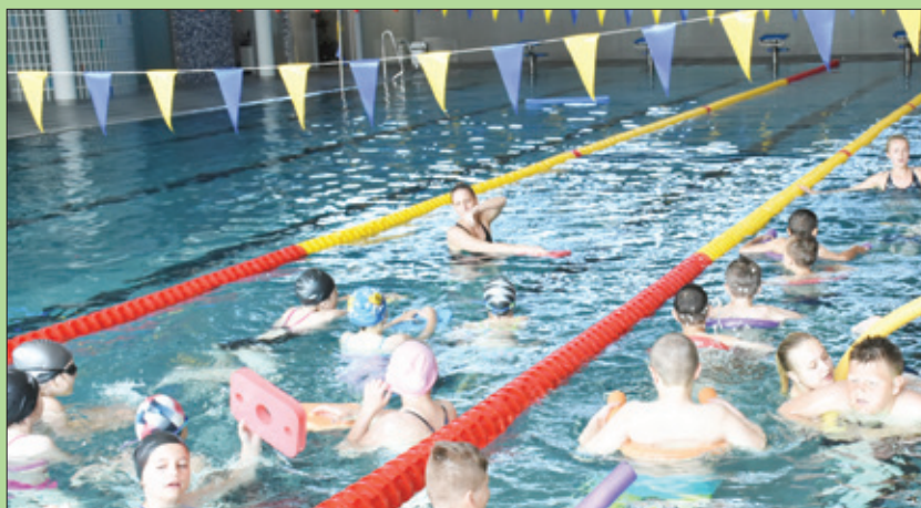
Žiaci zo ZŠ M. Medveckej na plaveckom výcviku.

Prvýkrát v histórii nášho mesta majú príležitosť rodičia a starí rodičia detí šancu chodiť spolu plávať bez toho, aby museli za týmto športom cestovať, a aj zároveň spoločne tráviť voľný čas, ale predovšetkým však ukázať deťom