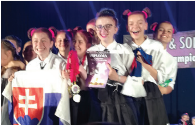
Tanečná skupina Girls Gang.

Víťazstvom v celoslovenskej súťaži vo výrazových tancoch Grand Finale Showtime v Leviciach, ktorá je najväčšia a najpopulárnejšia na Slovensku (zapojilo sa viac ako 3542 tanečníkov, 602 choreografií a 176 skupín v rámci Slovenska) sa naše tanečníčky prebojovali na Majstrovstvách Európy