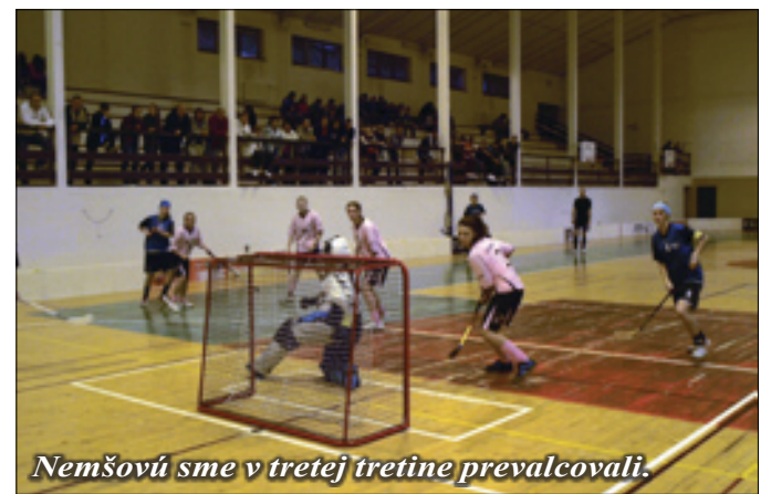
Nemšová sme v tretej tretine prevancovali.

Tvrdošín - Or. Jasenica, 1:3, Ballek, Skalité - Tvrdošín 0:6, Lajš 2, Balún 2, Žmuráň a Janol, Tvrdošín - Belá 3:1, Repka, Bránický, Lajš, Or. Veselé - Tvrdošín 4:3, Balún, Gallas, Lajš, Tvrdošín - Bytča, 2:2, Gallas, Lajš, Varín - Tvrdošín 2:4, Repka 2, Gerát, Žmuráň, Tvrdošín - Habovka, 0:0, Tvrdošín - Trstená 1:3, Gallas, ZA Mojš - Tvrdošín 1:4, Repka 2, Lajš, Janol, Tvrdošín - Rajec 2:0, Repka 2.