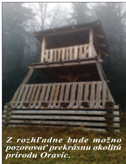
Z rozhľadne bude možno pozorovať krásnu okolitú prírodu Oravice.

v Oraviciach si nielen zdraví, ale aj ľudia so zníženou schopnosťou pohybu môžu pozrieť ďalšie krásne zákutia prírody. Taki, ktorí sa chcú prejsť dolinami, oddýchnuť pri hračiacich bystrinách, takúto možnosť majú napríklad v Tichej a Bobroveckej doline, ktoré sa už zaradili ku turistickým lokalitám bez bariér a sú prístupné pre turistov so zníženou schopnosťou pohybu.