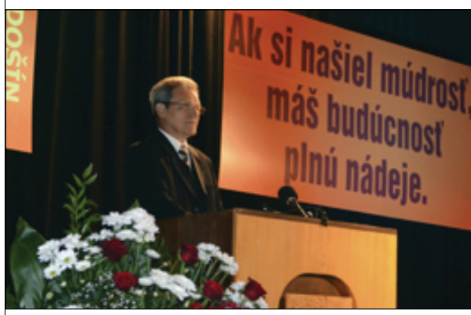
Školu úspešne vedie od roku 2004 riaditeľ J. Korenčíak.

Pod rovnomeným heslom sa niesli oslavy 50. výročia založenia Spojenej školy, ktorej sa 7. októbra zúčastnili zástupcovia Zlínskeho samosprávneho kraja, Krajského školského úradu ŽSK, Katolíckej univerzity v Ružomberku, hostia zo Zlínskej a Trenčianskej univerzity, zástupcovia partnerských škôl z Poľska, Českej republiky a ďalší hostia.