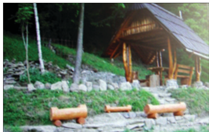
Altánky budú slúžiť k oddychu a ochrane pred nepriaznivým počasím.