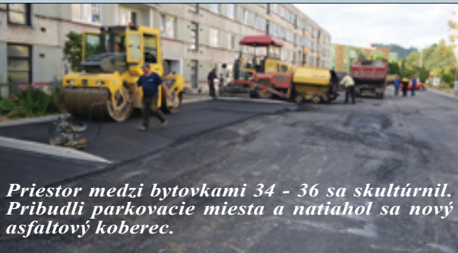
Priestor medzi bytovkami 34 - 36 sa skultúrnil. Pribudli parkovacie miesta a natiahol sa nový asfaltový koberec.

Týmito prácami medzi bytovkami č. 36 a 34 sa rozšírením a spevnením plôch zlepšila situácia pre parkovanie osobných motorových vozidiel občanov bývajúcich v tejto lokalite a nielen to, pretože tu bola urobená