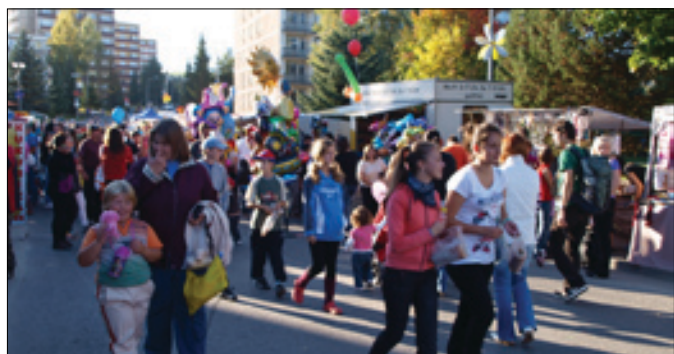
Jarmočné priestory boli plné už od rána.

Už po jedenástykrát sa na Michalskom námestí uskutočnil 30. septembra tradičný Michalský jarmok a smelo môžeme povedať, že hľadám najvydarenejší za ostatné roky, pretože mu mimoriadne prišlo aj pekné slnečné počasie a ľudia sa výborne bavili až do neskorých nočných hodín pri kultúrnom programe. Okrem