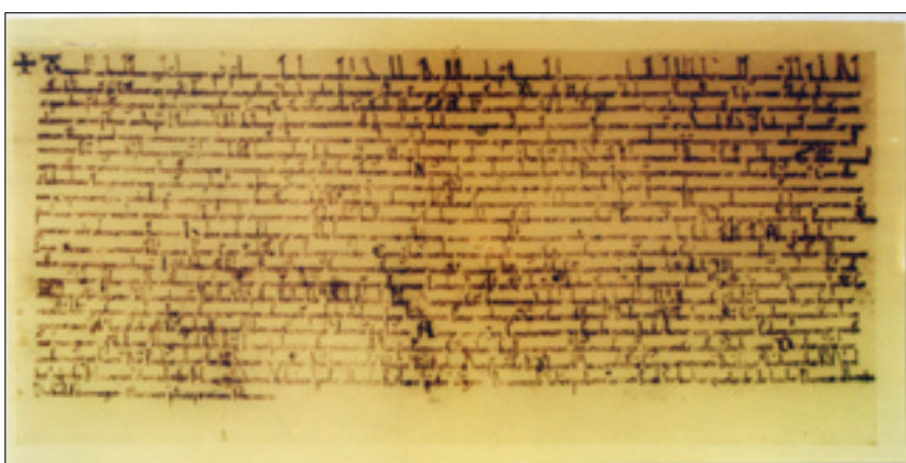
„V mestskom úrade sa nachádza kópia Zoborskej listiny z roku 1111.“

Tieto opakované fakty akosi nevedia „prezrieť“, či preglgnúť niektoré oravské médiá alebo tí, čo takto píšú (nemajú o čom písať alebo sú nie schopní niečoho múdrejšieho?), napr. výrokmi: „Čas sa zbláznil. Od roku 1965 pribudlo mestu dvesto rokov. Ľudia hovorili najprv o preklepe na plagáte, ktorý pozýval na Dni mesta pri príležitosti 900. výročia prvej písomnej zmienky o Tvrdošine.“