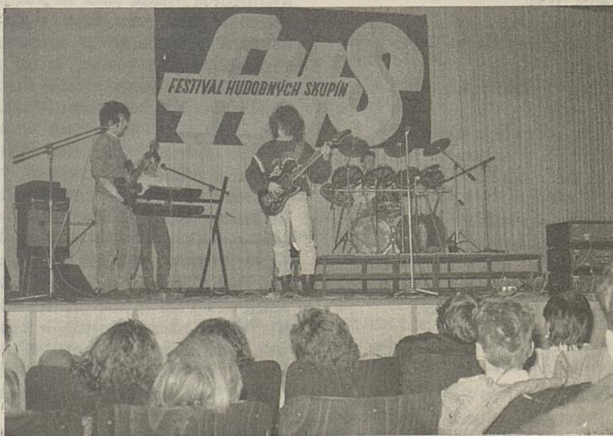
Na snímke jedni z účastníkov, skupina WIND, zložená so študentov SPS Tvrdošín

Ci podujatie splnilo svoj cieľ? Odpoveď nám môže dať dobrý pocit z vydareného podujatia všetkých účinkujúcich a organizátorov. Skoda len, že hľadisko bolo poloprázdne. A koho by to viac zaujímalo, môže si zakúpiť natočenú videokazetu v MsKS na sídlisku Medvedzie. L. O.