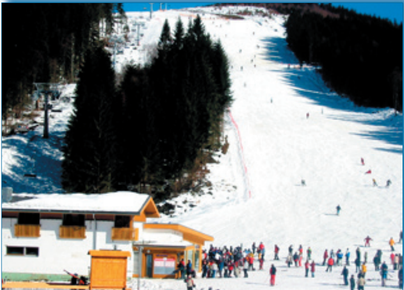
Pohľad na novú zjazdovku Ski parku v Oraviciach s prvými lyžiarmi.

V Oraviciach sú už dnes na lyžovačku a oddych tie najlepšie podmienky, ktoré spĺňajú požiadavky moderného turistického centra. A preto aj touto cestou pozývam všetkých Slovákov do Oravíc, pretože zahraniční turisti a najmä Poliaci tento kút Oravy už dávno objavili.