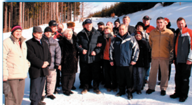
Poslanci mestského zastupiteľstva a členovia výboru urbáru v Tvrdošíne s pánom prezidentom na vrchole areálu zimného strediska.