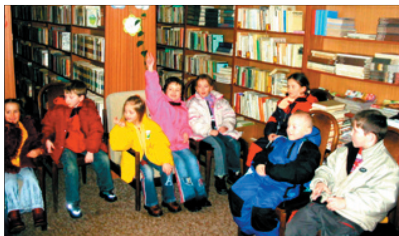
Najlepšia investícia je do tých najmenších.

A čo dodať na záver. Hádám iba výrok Pliniusa „Nijaká kniha nie je až taká zlá, aby sme sa z nej niečo nenaučili.“ (jh)