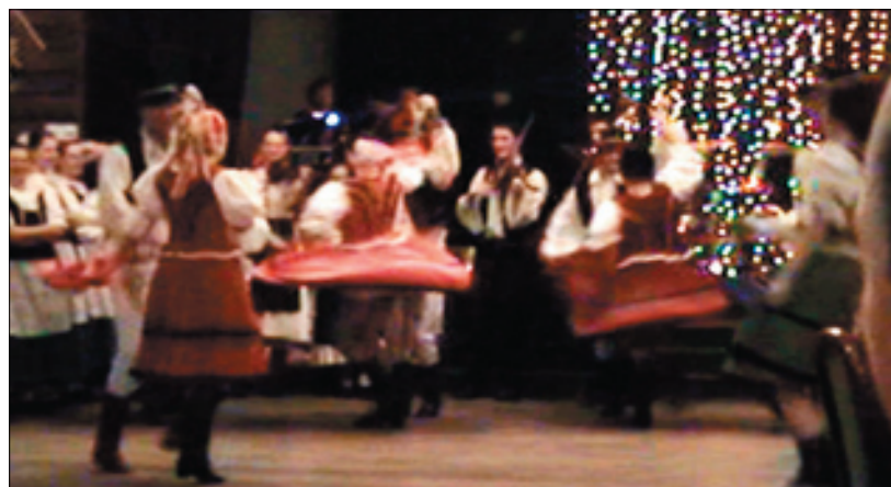
Na mestskom bále nás pobavil folklórny súbor Senior Oravan.

105 cenami od štedrých sponzorov. Môžeme konštatovať, že tohtoročný mestský bál sa vydaril a všetci dobre cítili a zabávali.