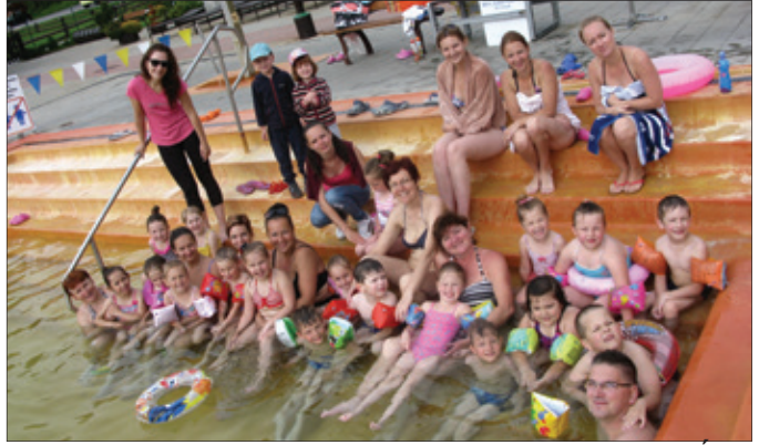
Termálne kúpaliská sú pripravené na letnú sezónu. Hlboké vody v bazéne prispôsobili zamestnanci aj našim najmenším Tvrdošičanom z materských škôl.

Keď sa rozhodnete zájsť na rozhľadňu nad Záhradkárskou oblasťou nad Úplňňou naskytnete sa vám nádherný výhľad zo všetkých svetových strán. Srdece sa rozbúši už len pri pohľade na úžasnú panorámu Západných