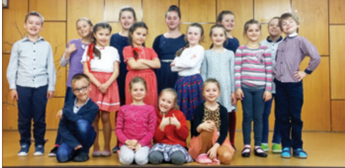
Školské kolo spevackej súťaže Slávik Slovenska.

aj v regionálnom kole, kde sa umiestnili na 1. mieste, v krajskej súťaži získali 2. miesto.