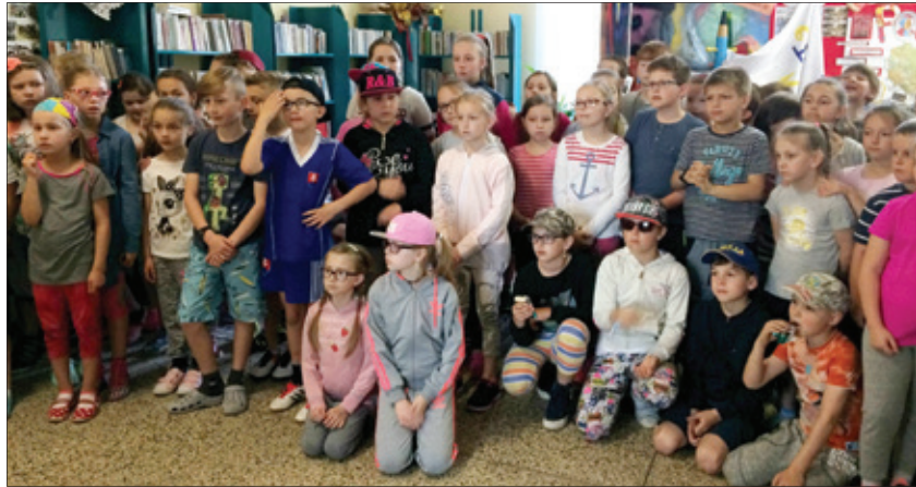
Žiaci sa aktívne zapojili do projektu Deň Zeme.