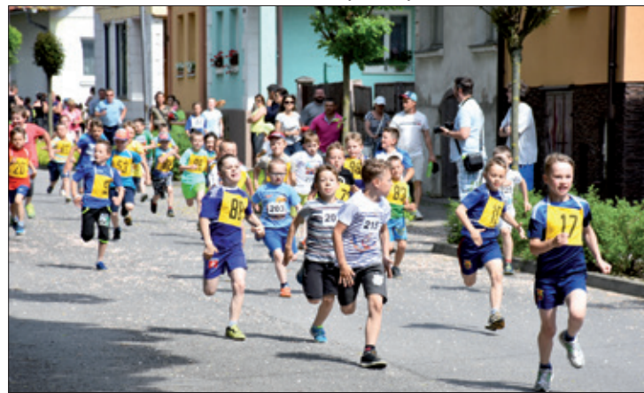
V každej bežeckej kategórii sa bolo na čo pozerat'.