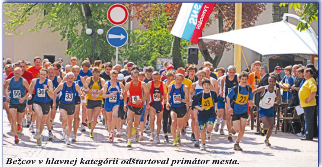
Bežcov v hlavnej kategórii odštartoval primátor mesta.