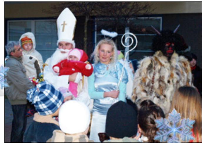
Mikuláš na Michalskom námestí.

Mikuláš so svojou družinou zavítal aj do domova služieb v našom meste. V zaplnenej spoločenskej sále si pre Mikuláša pripravili obyvatelia domova aj krátky kultúrny program, v ktorom mu na úvod zaspievali a zahrali na klavíri. Poniektorí mu stihli zarecitolovať básničku, či zaspievať pesničku. Veselo bolo aj pri rozdávaní darčiekov, či vystrájaní čertov a v závere nechýbalo ani poďakovanie Mikulášovi za to, že nezabudol ani na nich.