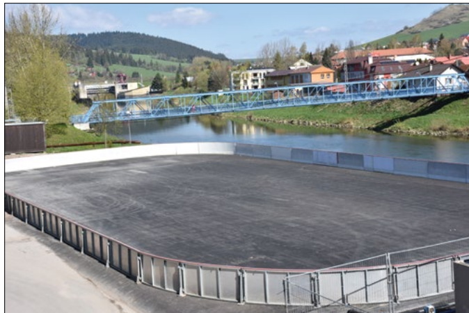
Hokejbalové ihrisko vytvorí podmienky pre nový šport v našom meste.

mat' rozmery vhodné nielen pre tréningovanie, ale aj na odohranie futbalových zápasov. K ihrisku sa robil prívod vody, povrch bol pripravený ťažkými mechanizmami. K obom