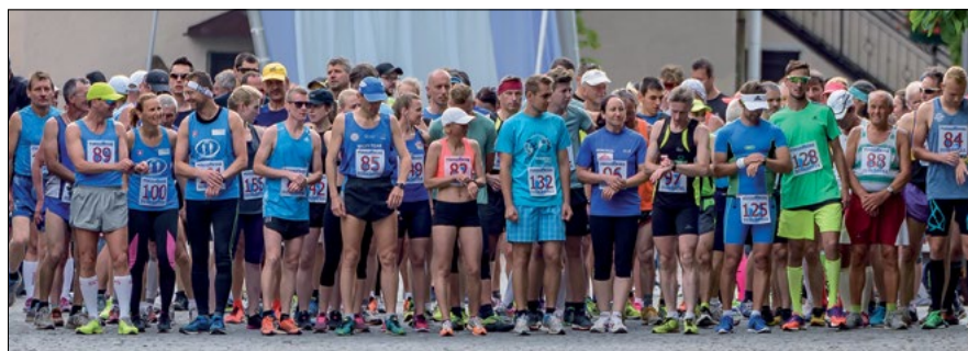
Štart hlavných kategórií na Tvrdošínskej dvanástke.