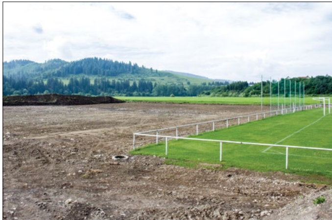
Vo futbalovom areáli pribudne nové futbalové ihrisko s trávnanou plochou.

Ku životu dospelých, ale najmä mládeže patrí aj šport a možnosť športovania. Medzi priority vedenia mesta Tvrdošín patrí podpora všetkých športov v meste, ako aj udržiavanie vybudovaných športovísk. Každé mesto a obec v okolí nám môže závidieť, že sa podmienky pre šport v Tvrdošine skvalitňujú nielen veľkou finančnou podporou zo strany vedenia mesta, ale aj pravidelným investovaním do nových športovísk, športových objektov a areálov.