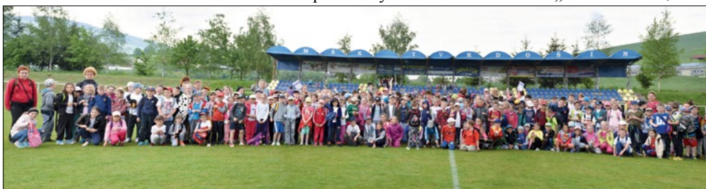
Spoločná fotka všetkých zúčastnených detí na záver Detských atletických pretekov.

porazeným.“ Inak to nebolo ani teraz. Každé dieťa, ktoré súťažilo, bolo odmenené a všetci odchádzali z ihriska s dobrým pocitom z podaných výkonov a s novými zážitkami.